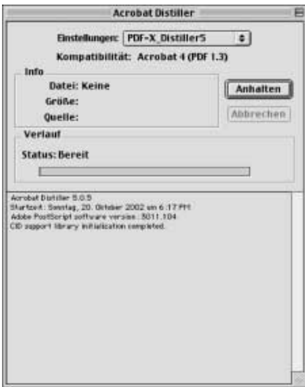
PDF-X_Distiller5 joboption einstellen