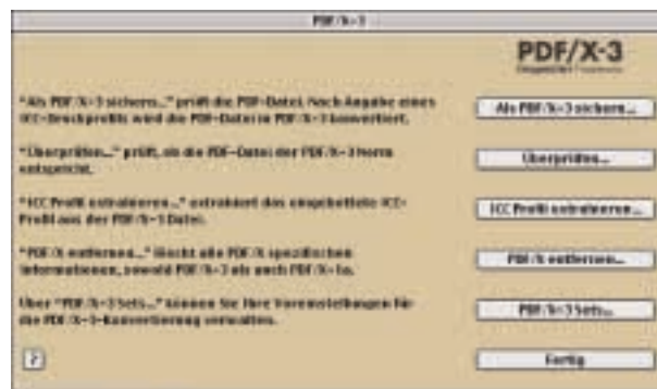
Hauptdialog des PDF/X-3 Inspector