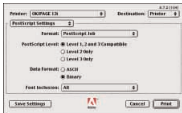
Einstellungen im Betriebssystem-Drucken-Dialog