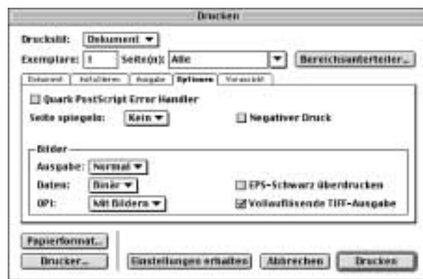
Einstellungen im XPress-Drucken-Dialog