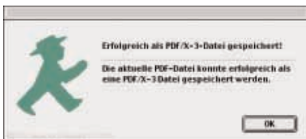
Die PDF-Datei konnte erfolgreich als PDF/X-3-Datei gespeichert werden.

Sofern PDF/X-3 Inspector keine Probleme festgestellt hat, erhält man die Bestätigung, dass die Konvertierung nach PDF/X-3 erfolgreich war.