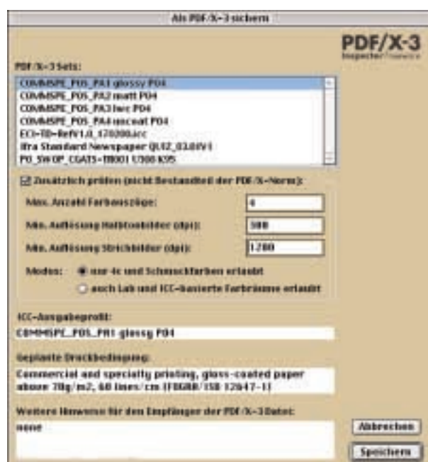
Auswahl der geplanten Druckbedingung sowie optional zusätzlicher Prüfungseinstellungen