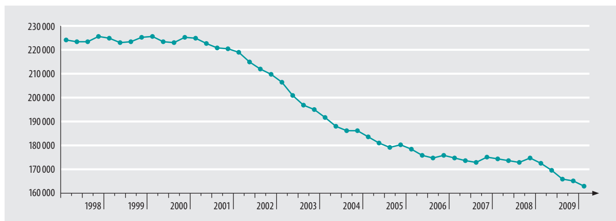
Sozialversicherungspflichtig Beschäftigte im deutschen Druckgewerbe